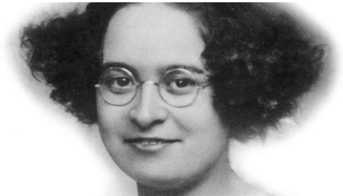
Amparo Poch y Gascón