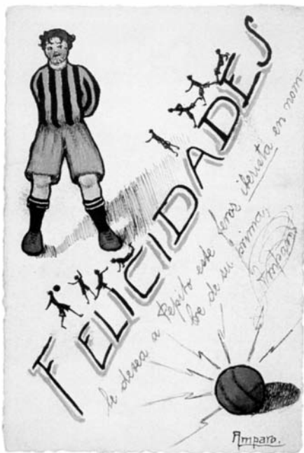
Dibujaba postales y pañuelos en sus primeros años de exilio.

Quisiera destacar uno de sus textos, que titula "Frente al gesto bélico", publicado en Tiempos Nuevos (1935), donde ella de nuevo se dirige a las mujeres, porque está convencida de la fuerza que ellas pueden tener para detener esta trágica guerra, y por otro lado rompe con el arquetipo de la mujer combatiente, la miliciana, que con gran proliferación se representaba en los carteles de la época, como si fuera el símbolo dominante de las mujeres republicanas: "¿qué debemos hacer las mujeres en este nuevo trance? ¿Otra vez ver marchar a los compañeros de todos los días? En aquel tiempo triste, vosotras tomasteis el arado en su nombre, además ¿cómo pudisteis ser tan crueles y tan ciegas? Fuisteis a las fábricas de armas y explosivos para empaquetar y pulir con vuestras manos la más odiosa de las muertes. La que iba zumbando, estallando, sobre las cabezas encogidas de otras mujeres... No prestéis oídos a los himnos nacionales ni a las palabras retumbantes que os hablan de falsos deberes patrióticos; sino a esa otra voz dulce y profunda que