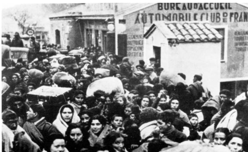
Refugiados españoles entran en Francia por el Perthus, en enero y febrero de 1939.

La doctora Amparo Poch, como presidenta de la IRG en España organiza una expedición de niños refugiados a México. En el mes de abril del 37, cerca de 500 niños son recibidos por pacifistas mexicanos. También cerca de 60 niños vascos fueron igualmente acogidos en una "Casa Vasca" en Inglaterra,