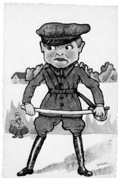
El dibujo del militar es una caricatura de su padre.

Traidor y asesino Por ser más certero? El niño soñaba, Jugaba sus sueños Pues ¿Qué era la guerra Si estaba tan lejos?